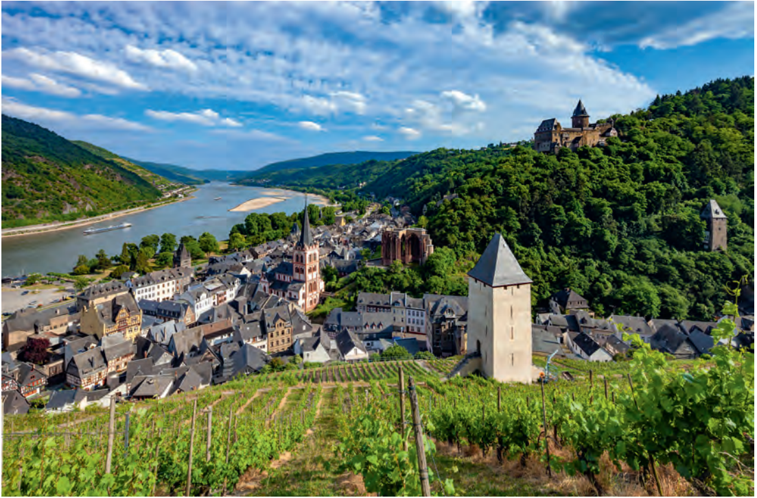
Blick von Norden auf Bacharach