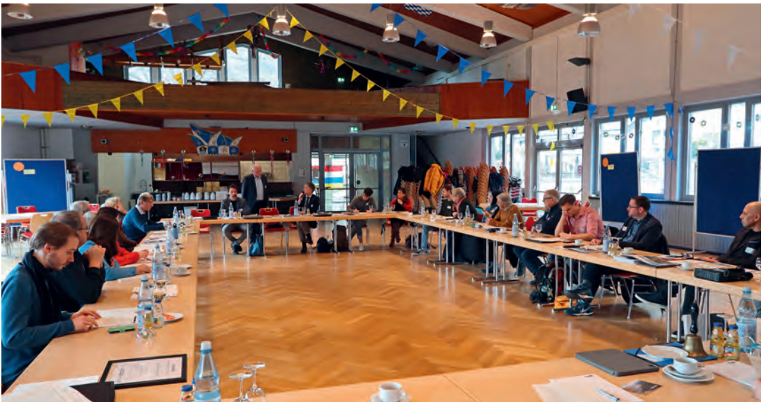
Beim Workshop in der Mittelrheinhalle Bacharach

Zusammen mit zwei weiteren Burgen – Stahlberg in der Nachbarschaft und Virneburg in der Eifel – gehört Stahleck seit 1909 dem Rheinischen Verein für Denkmalpflege und Landschaftsschutz (RVDL). Dieser hat das Objekt bereits vor Jahrzehnten dem Verein Die Jugendherbergen in Rheinland-Pfalz und im Saarland zur Nutzung überlassen. Nun steht die Neufassung des Erbbaurechtsvertrages an – und damit die Entscheidung, wie es mit der Burg finanziell, baulich und touristisch weitergeht.