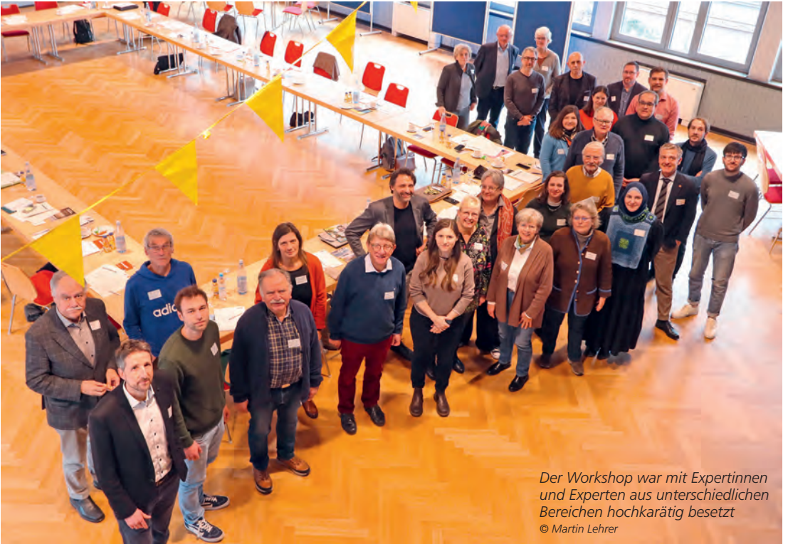
Der Workshop war mit Expertinnen und Experten aus unterschiedlichen Bereichen hochkarätig besetzt

Die Teilnehmerinnen und Teilnehmer am Workshop: